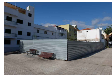
* PLAZA - UBICACIÓN DE LA ANTIGUA IGLESIA