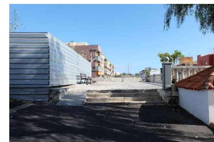
* ACCESO DESDE CALLE Dña JULIA TRUJILLO

Título ESTUDIO DE DETALLE PARCELA PARA LA IGLESIA DE NS DE CANDELARIA Emplazamiento C/ DÑA. JULIA TRUJILLO Nº 1, ALCALÁ T.M. GUÍA DE ISORA - TENERIFE Promotor OBISPADO DE TENERIFE Arquitecto ALEJANDRO BEAUTELL GARCÍA