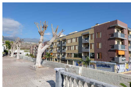
* VISTA PLAZA HACIA CALLE 1º DE MAYO