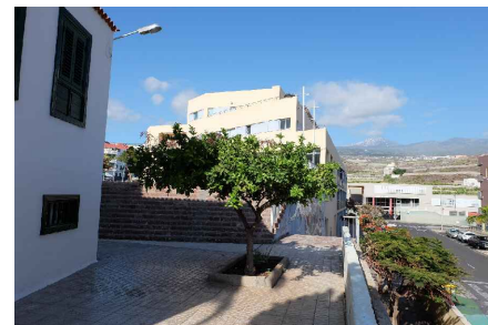
* VISTA LATERAL CALLE 1º DE MAYO HACIA CALLE IKBAL MASIH