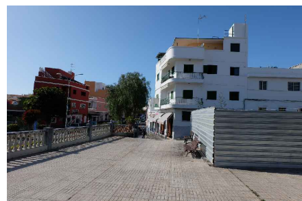
* VISTA PLAZA HACIA CALLE Dña JULIA TRUJILLO