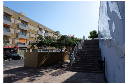
* ESCALERA ACCESO CALLE 1º DE MAYO