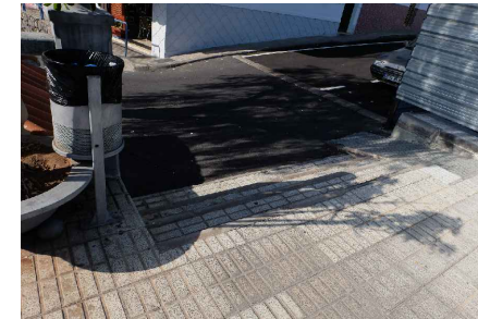
* ACCESO DESDE CALLE Dña JULIA TRUJILLO