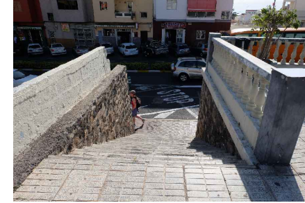
* ESCALERA ACCESO AVDA. LOS PESCADORES