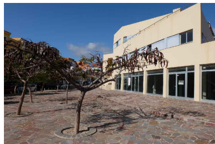
* PLAZA POSTERIOR