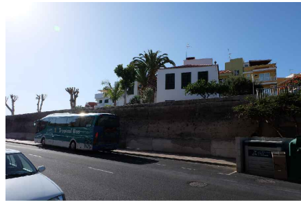
* LATERAL CALLE 1º DE MAYO