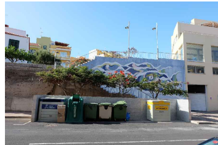
* ACCESO CALLE 1º DE MAYO