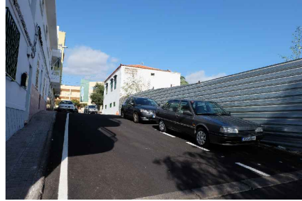
* LATERAL CALLE Dña JULIA TRUJILLO