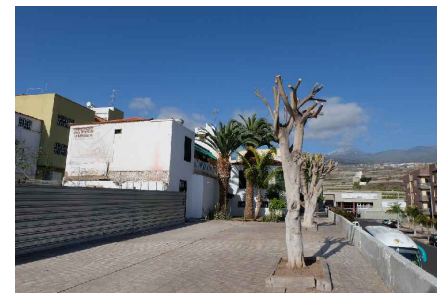
* VISTA LATERAL CALLE 1º MAYO HACIA CALLE IKBAL MASIH