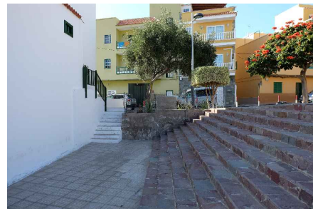
* PLAZA POSTERIOR VISTA HACIA CALLE Dña JULIA TRUJILLO