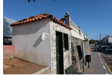
* FRENTE AVDA. LOS PESCADORES