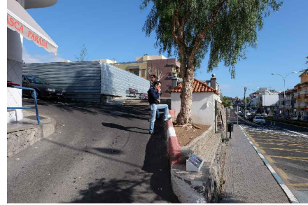
* ESQUINA CALLE Dña JULIA TRUJILLO AVDA. LOS PESCADORES