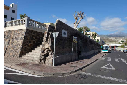
* ACCESO AVDA. LOS PESCADORES, LATERAL CALLE 1º DE MAYO