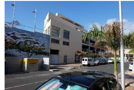
* LATERAL CALLE 1º DE MAYO