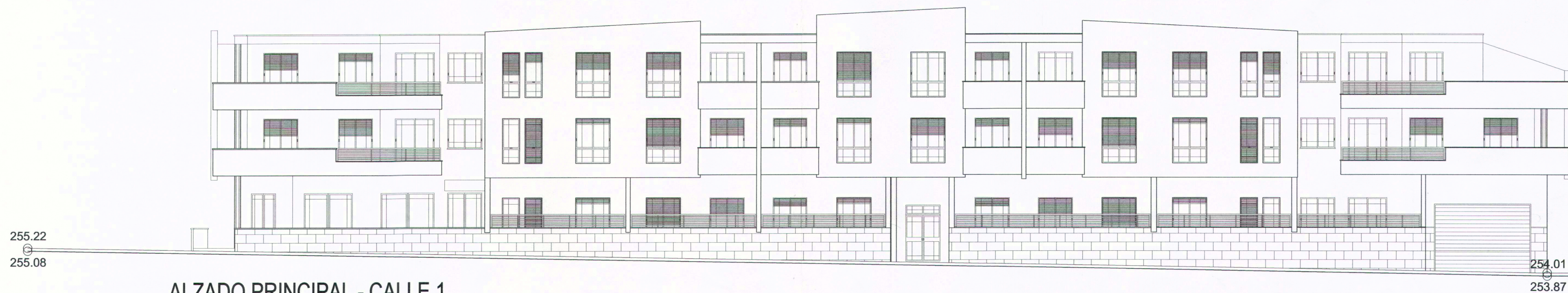
ALZADO PRINCIPAL - CALLE 1