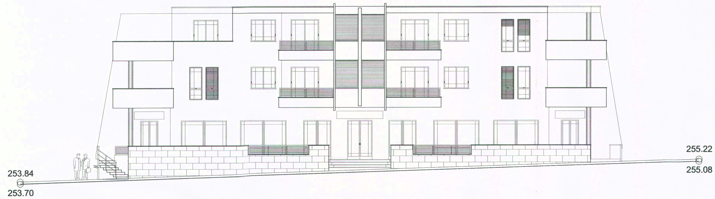
ALZADO LATERAL IZQUIERDO - CALLE 3