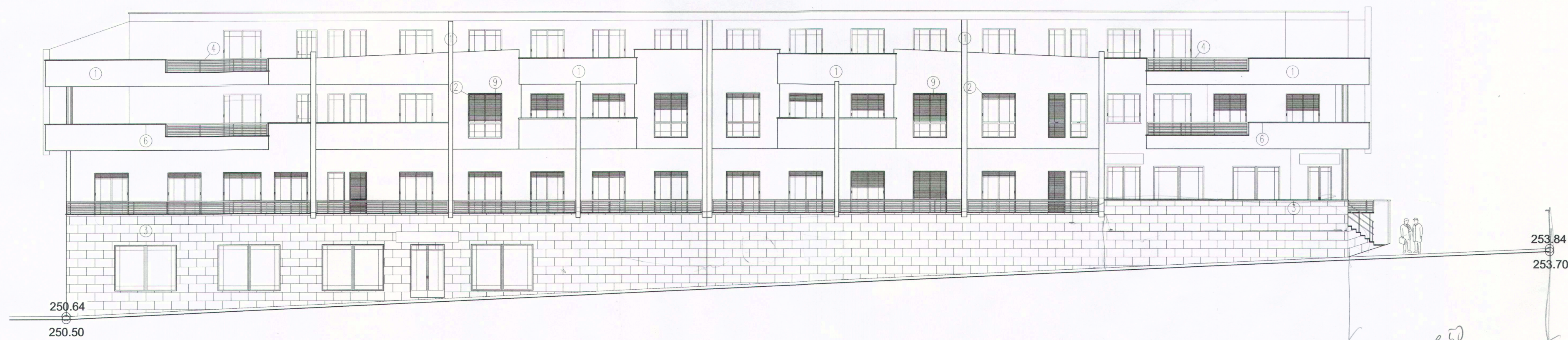
ALZADO POSTERIOR - CALLE 2