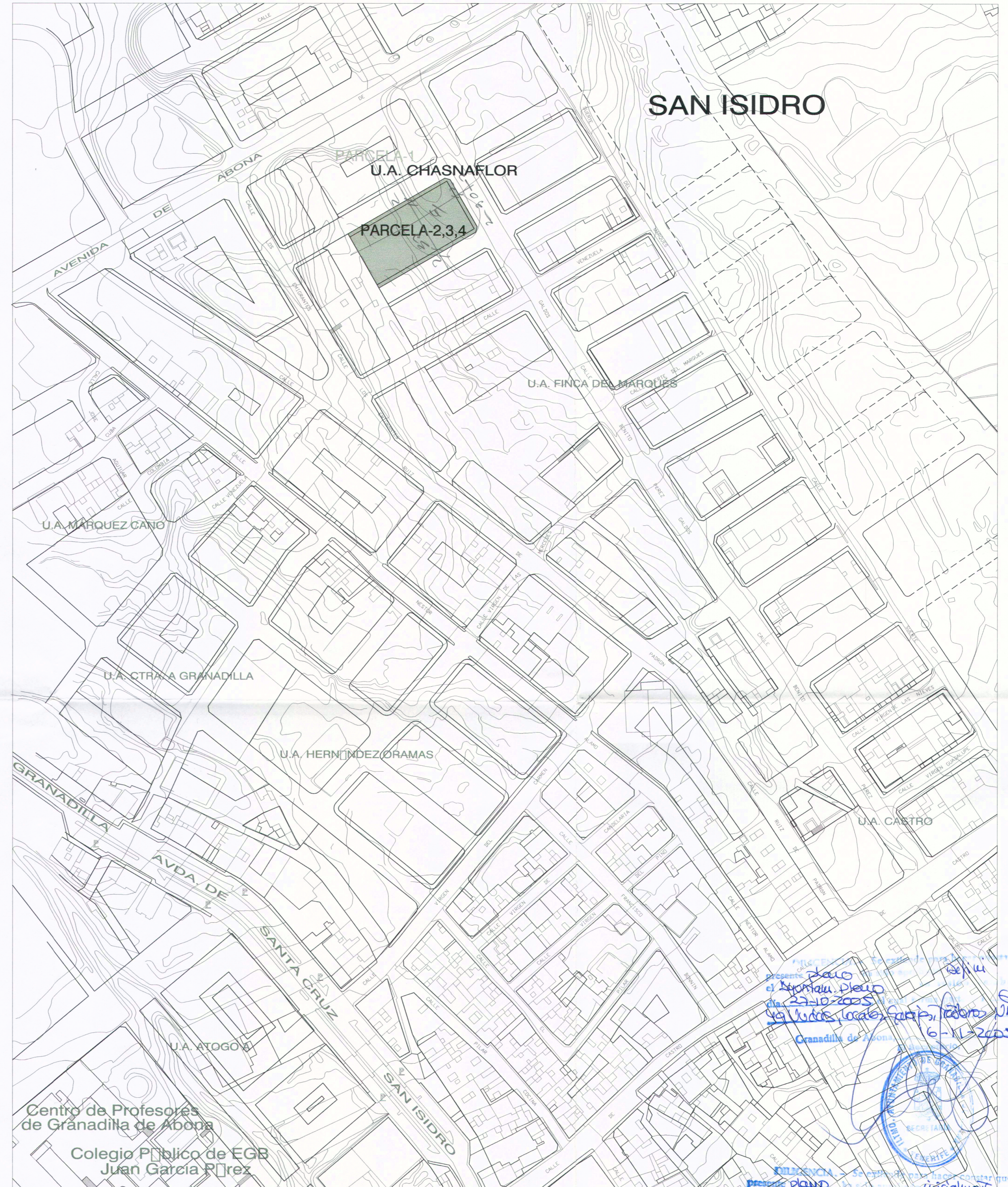
SITUACION E. 1:1500