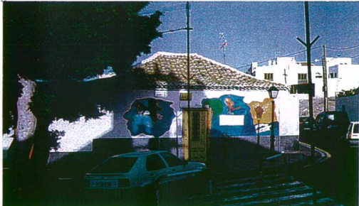
3 EDIFICIO DEL SIGLO XVI Y XVII