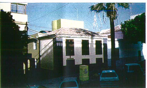
4 EDIFICIO DEL SIGLO XVII