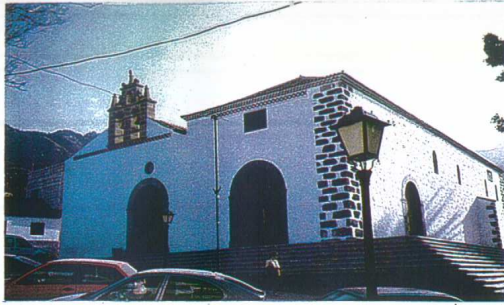
1 IGLESIA DE SANTA ÚRSULA