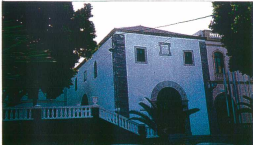
2 ANTIGUA IGLESIA DEL CONVENTO DE SAN FRANCISCO