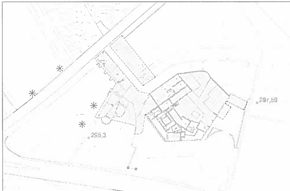
Delimitación del bien protegido