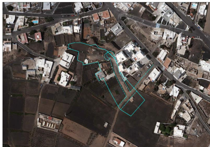
Ortofoto con la delimitación de suelo urbano propuesta

Personada la técnico que suscribe este informe en la Calle Las Rosas Sur se comprueba que dicho suelo cuenta con: