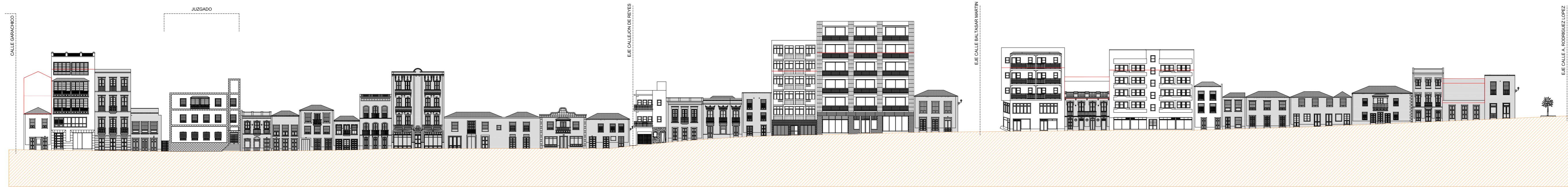
ALZADO OESTE (Parcial) CALLE ANSELMO PEREZ DE BRITO