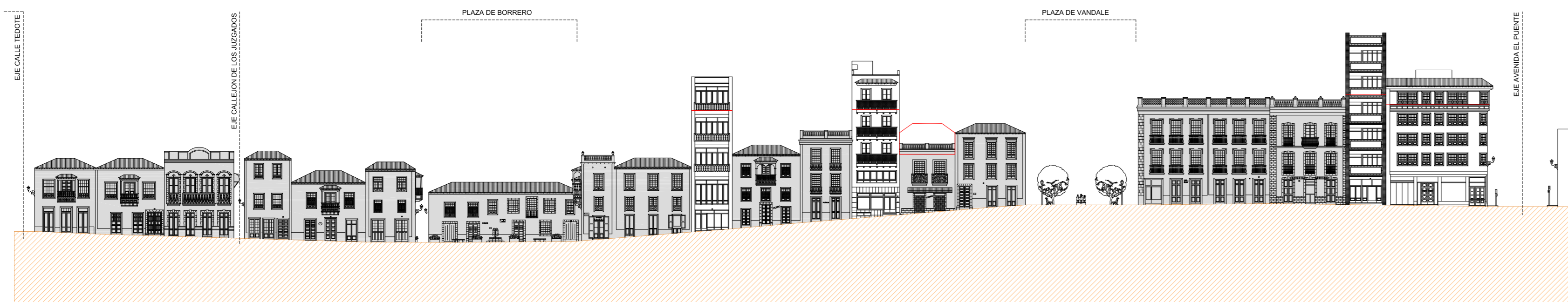
ALZADO ESTE (Parcial) CALLE ANSELMO PEREZ DE BRITO