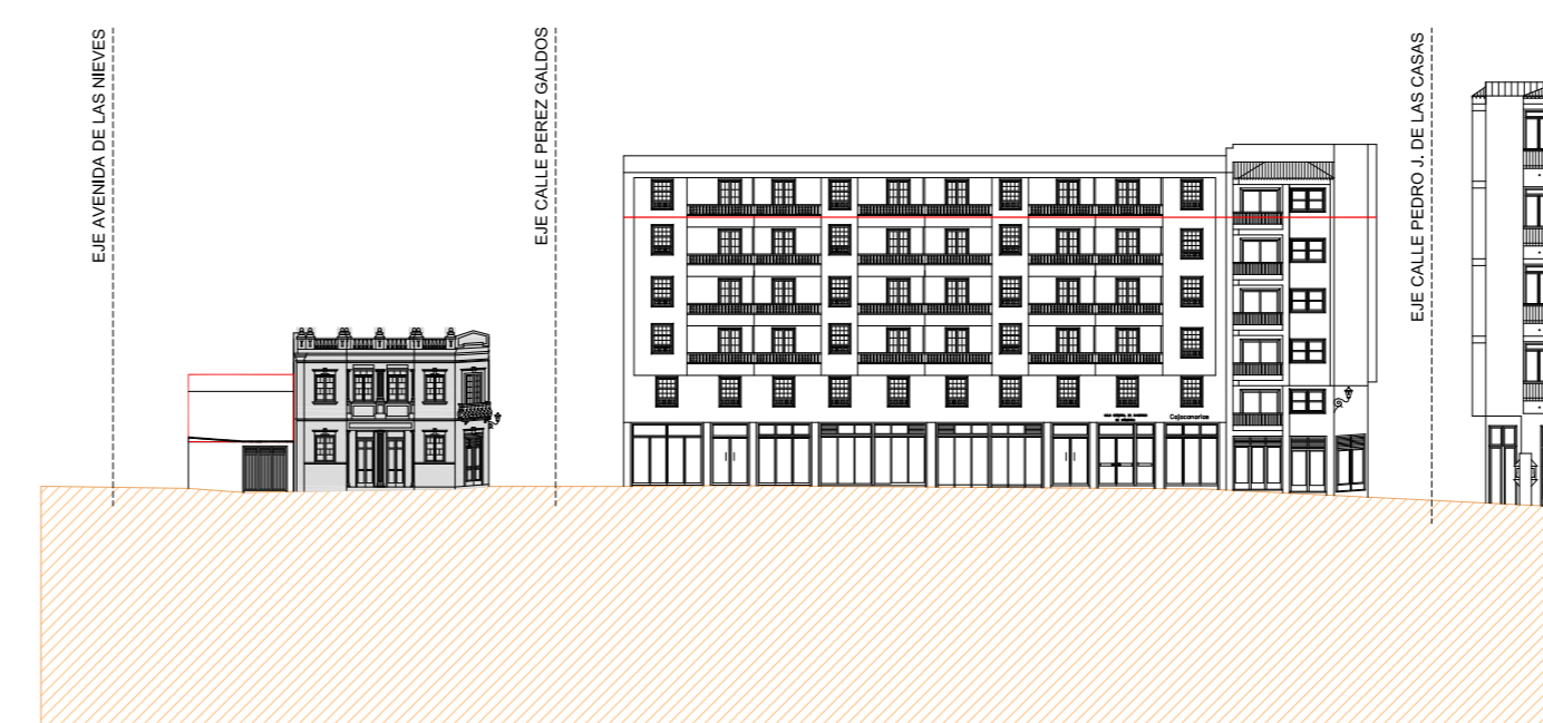
ALZADO ESTE CALLE DOCTOR PÉREZ CAMACHO (Alameda)