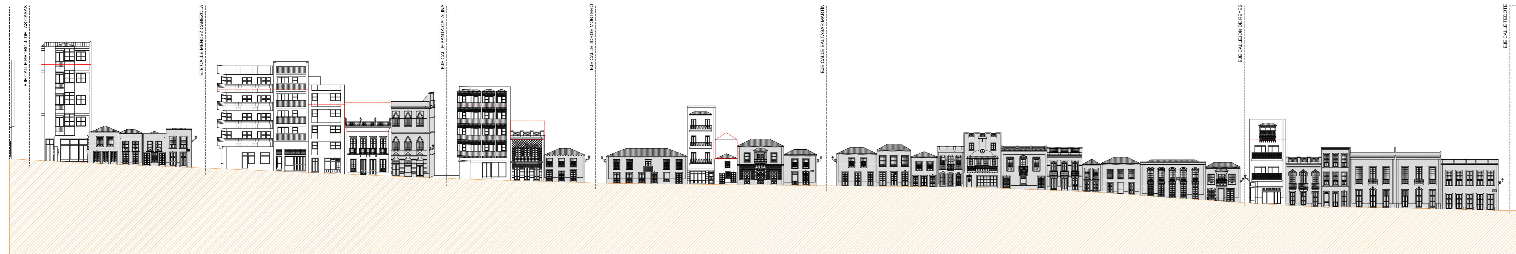
ALZADO ESTE (Parcial) CALLE ANSELMO PEREZ DE BRITO