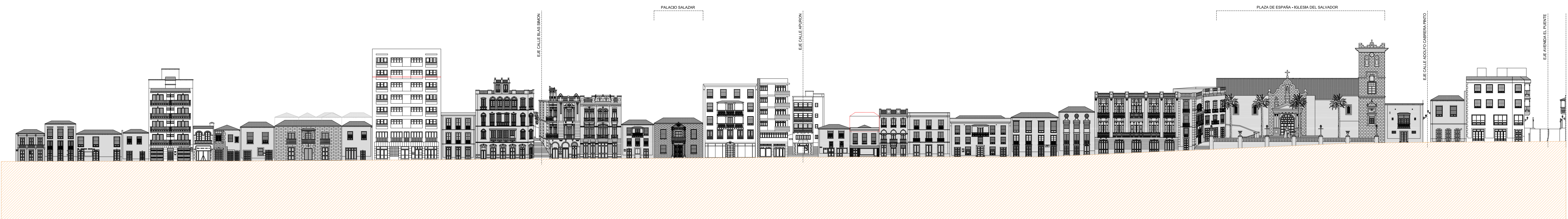
ALZADO OESTE CALLE O'DALY