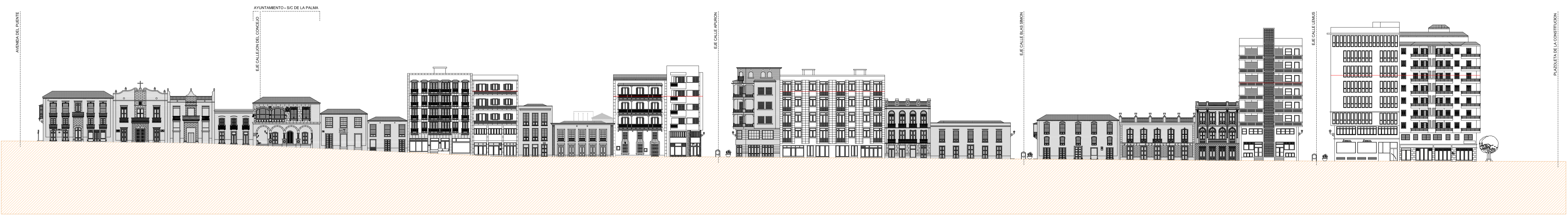
ALZADO ESTE CALLE O'DALY