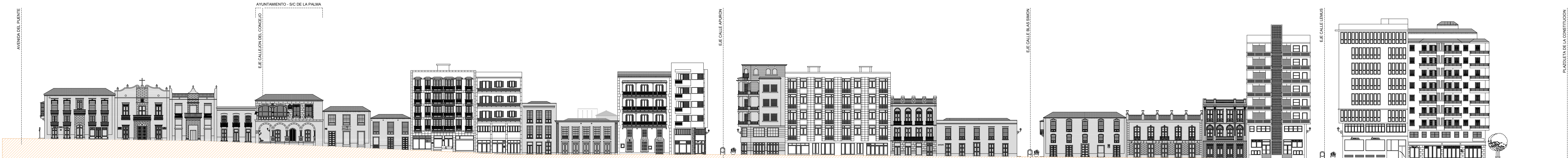
ALZADO ESTE CALLE O'DALY