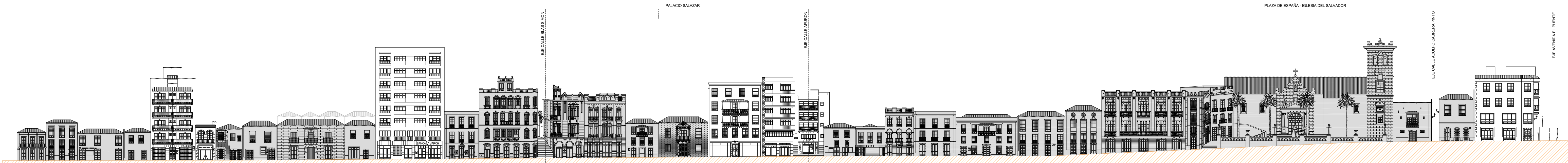
ALZADO OESTE CALLE O'DALY