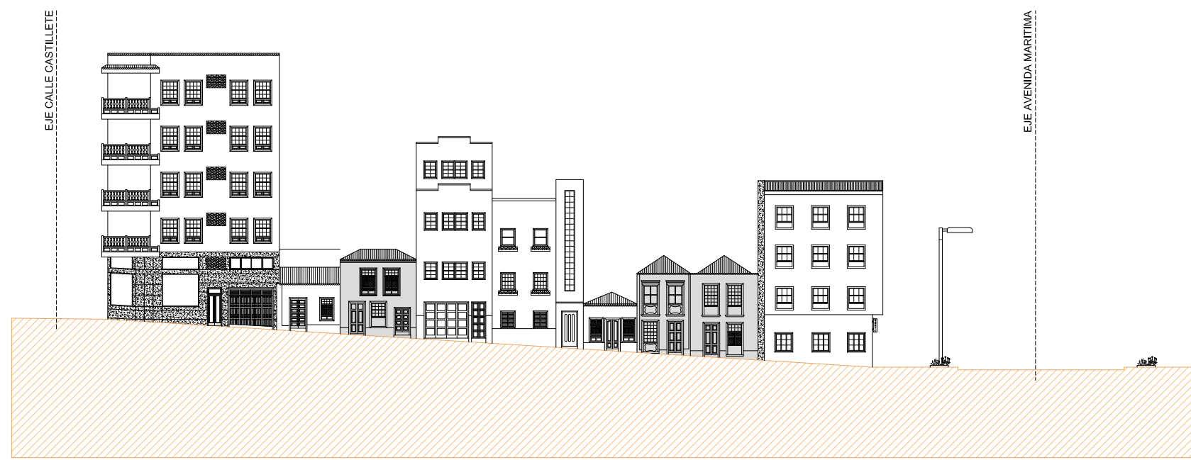
ALZADO NORTE CALLE SANTA CATALINA