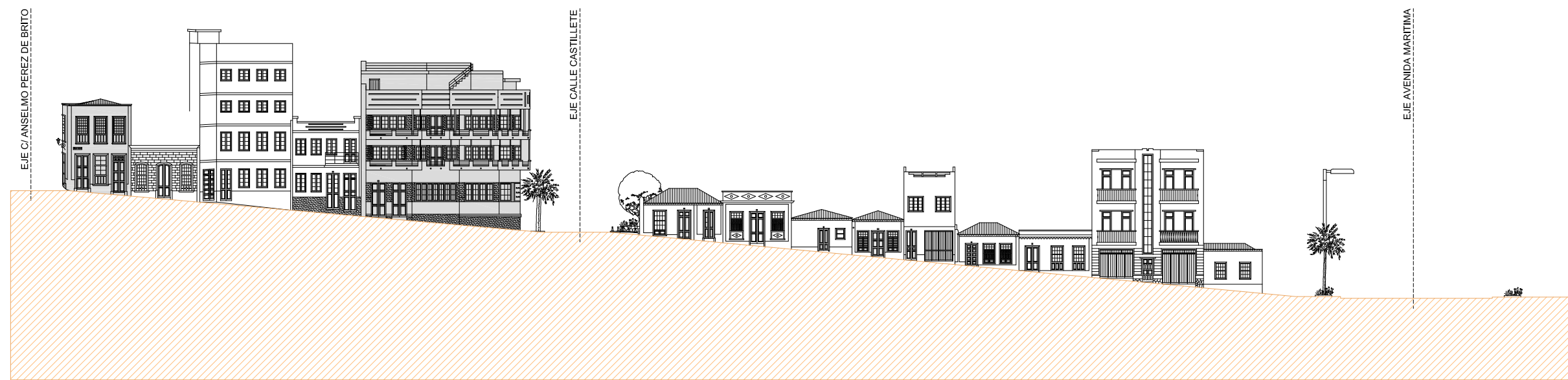
ALZADO NORTE CALLE MENDEZ CABEZOLA