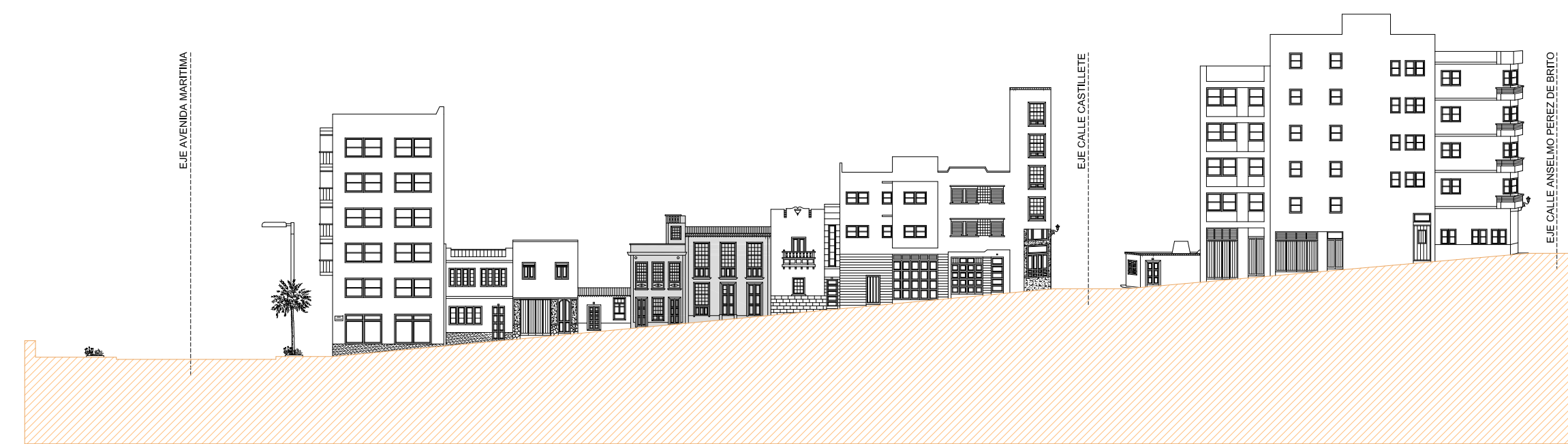
ALZADO SUR CALLE MENDEZ CABEZOLA