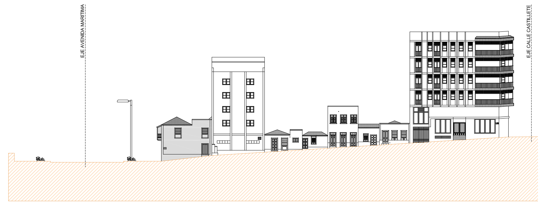
ALZADO SUR CALLE SANTA CATALINA