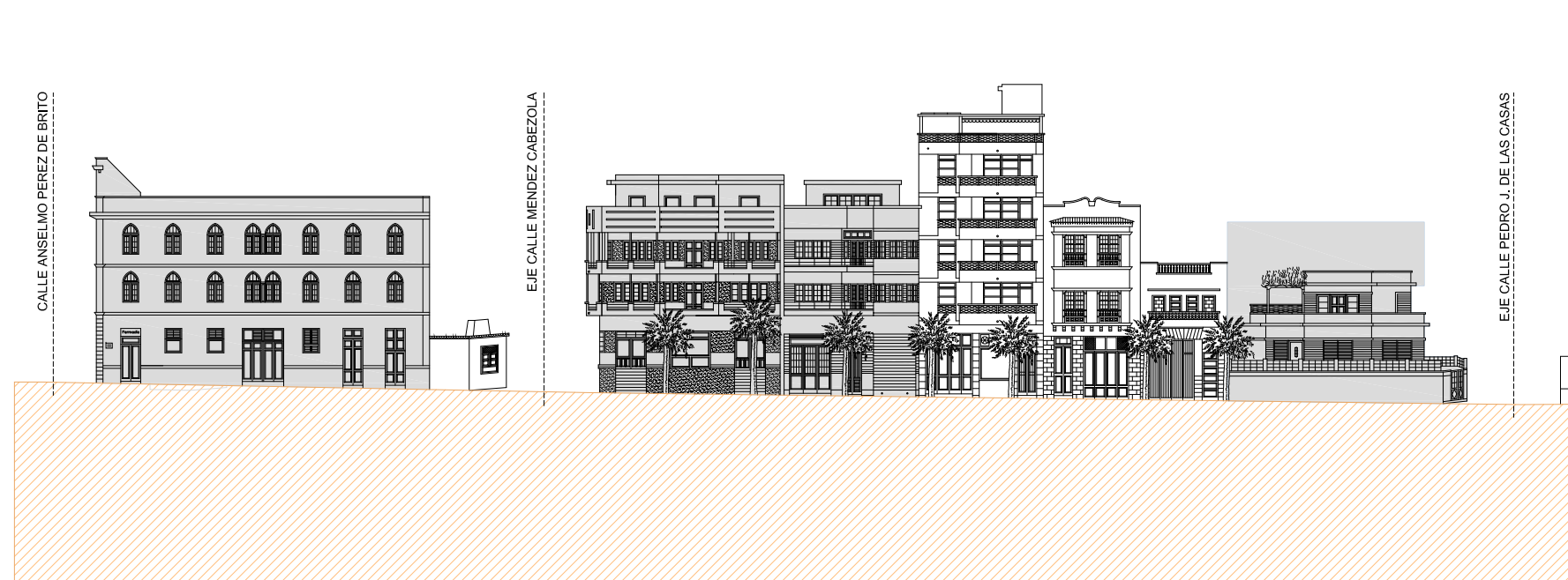
ALZADO OESTE CALLE CASTILLETE