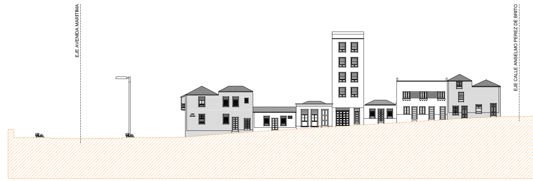
ALZADO SUR CALLE JORGE MONTERO