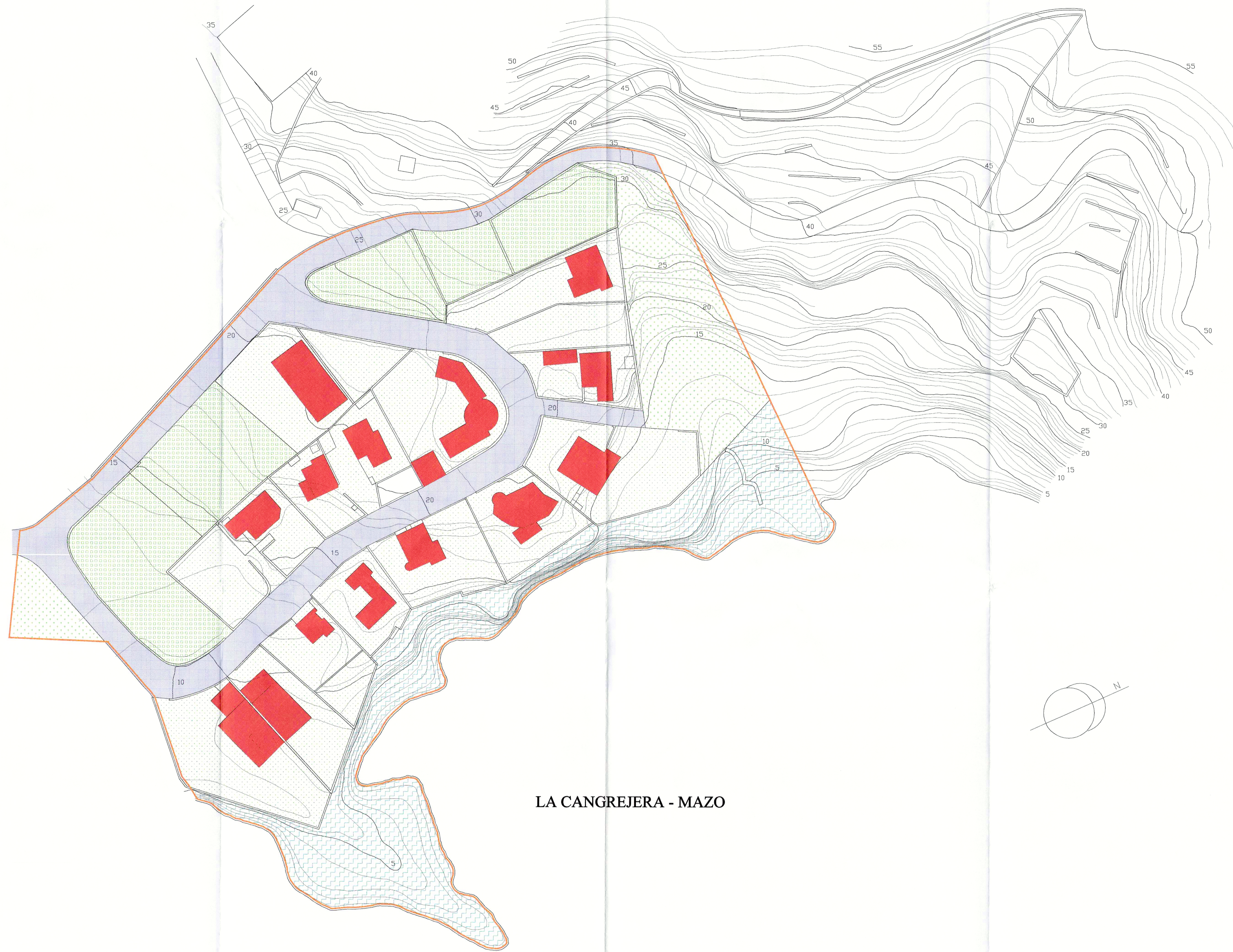
LA CANGREJERA - MAZO

AYUNTAMIENTO DE VILLA DE MAZO Código Postal 38730 (LA PALMA) Santa Cruz de Tenerife Teléfonos: 922 44 00 01 - 922 44 03 25 Fax: 922 42 82 47