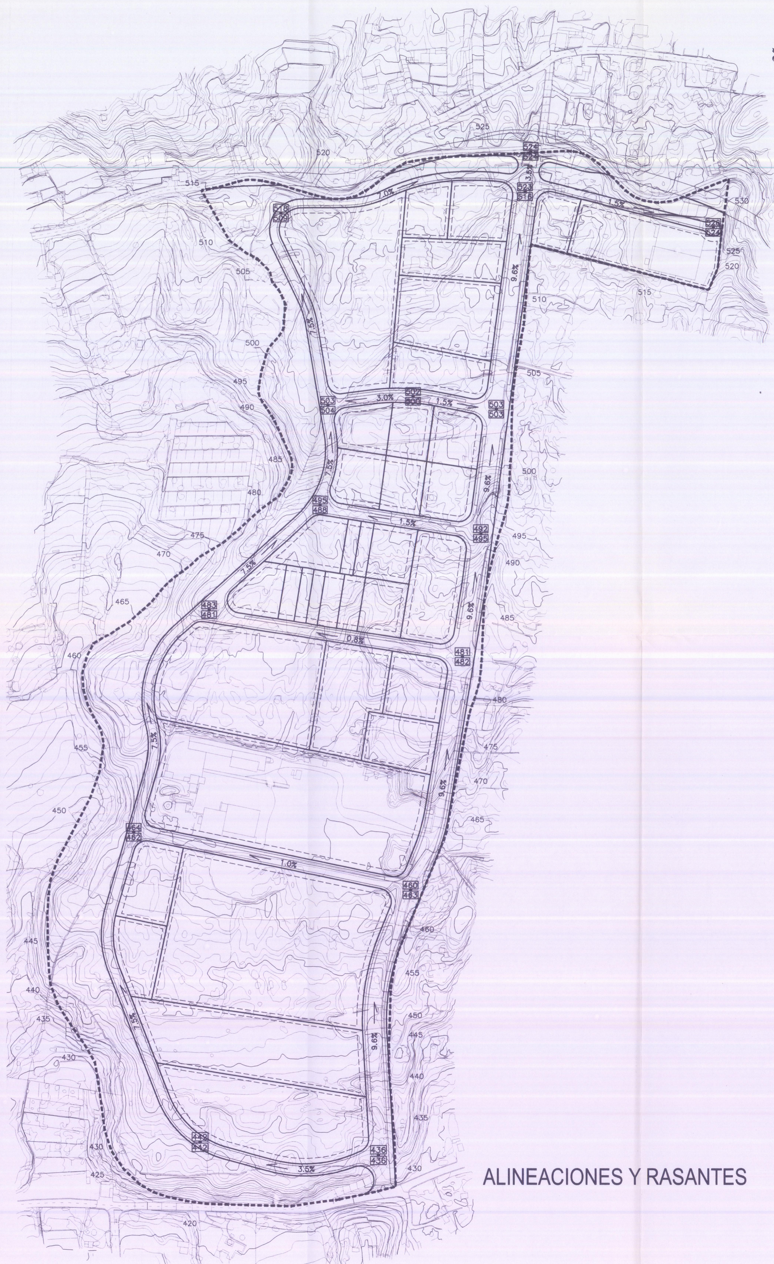
ALINEACIONES Y RASANTES