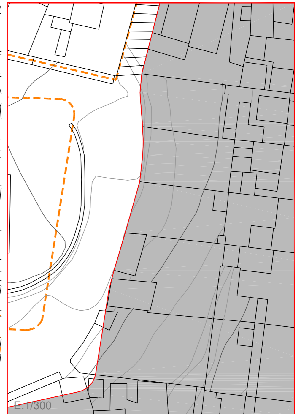
DETALLE DE LA ZONA AFECTADA DONDE LAS ALINEACIONES DEL PLAN GENERAL NO SE AJUSTAN AL TRAZADO REAL DE LAS FACHADAS