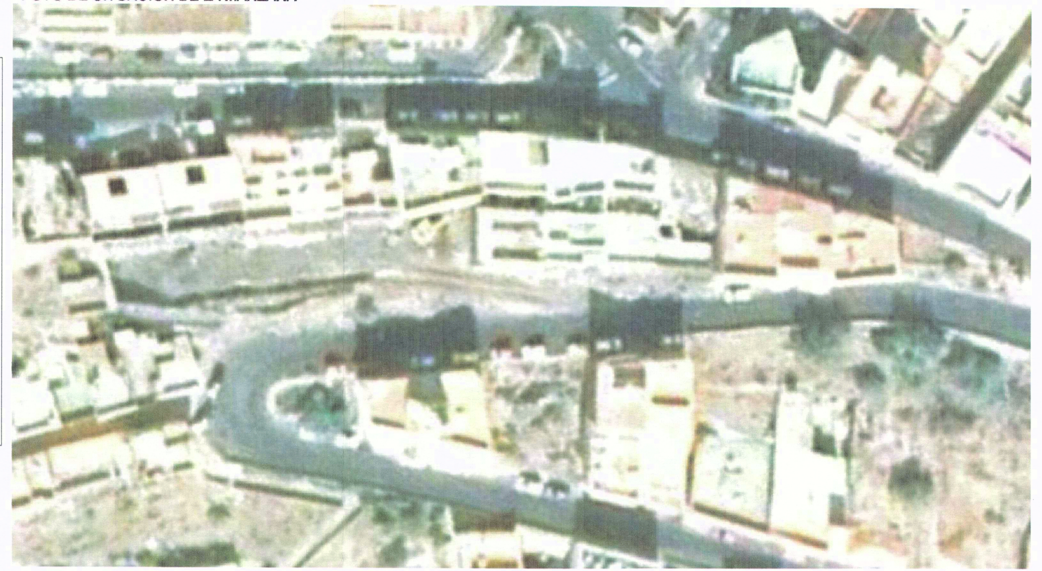
FOTO DE SITUACION DE LA MANZANA

ALINEACIONES SEGÚN PGOU ACOTADO GENERAL DE PARCELA A MODIFICAR.