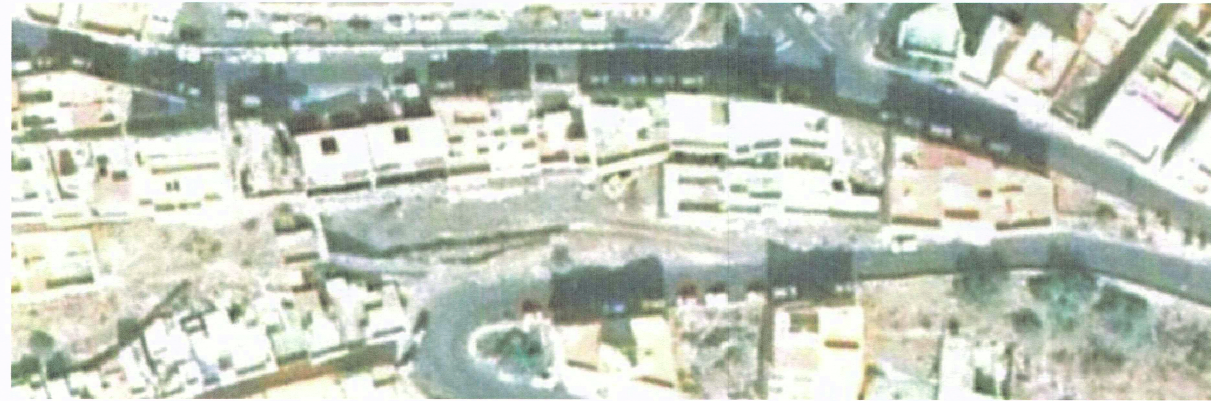
FOTO DE SITUACION DE LA MANZANA

Superficie de suelo : 400,62 m 2 /suelo. Ocupación máxima de parcela : (100 %) = 400,62 m 2 . Tipo edificatorio : ALINEADA A VIAL. Número máx. de plantas : 2 plantas / 6,80 mts. Uso permitido : RESIDENCIAL Y COMERCIAL Clases de usos permitidos : VIVIENDA UNIFAMILIAR Y VIVIENDA COLECTIVA Solar mínimo . 70 m 2 /suelo Frete mínimo : 6 metros lineales. Otras : TERRENO EN LADERA CON PENDIENTE SUPERIOR AL 20%.