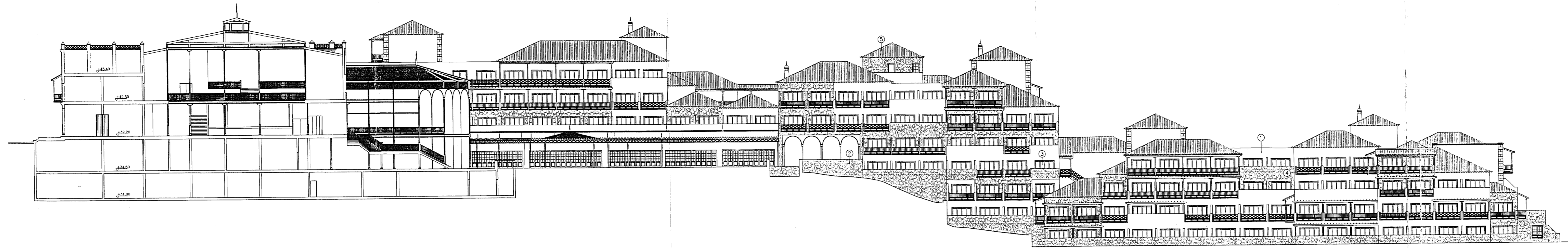
FACHADA LATERAL IZQUIERDA INTERIOR