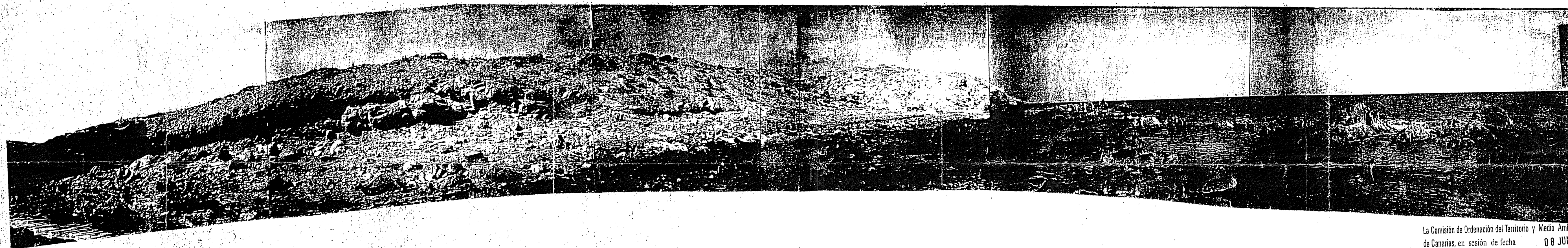
FOTOGRAFIA Nº 6