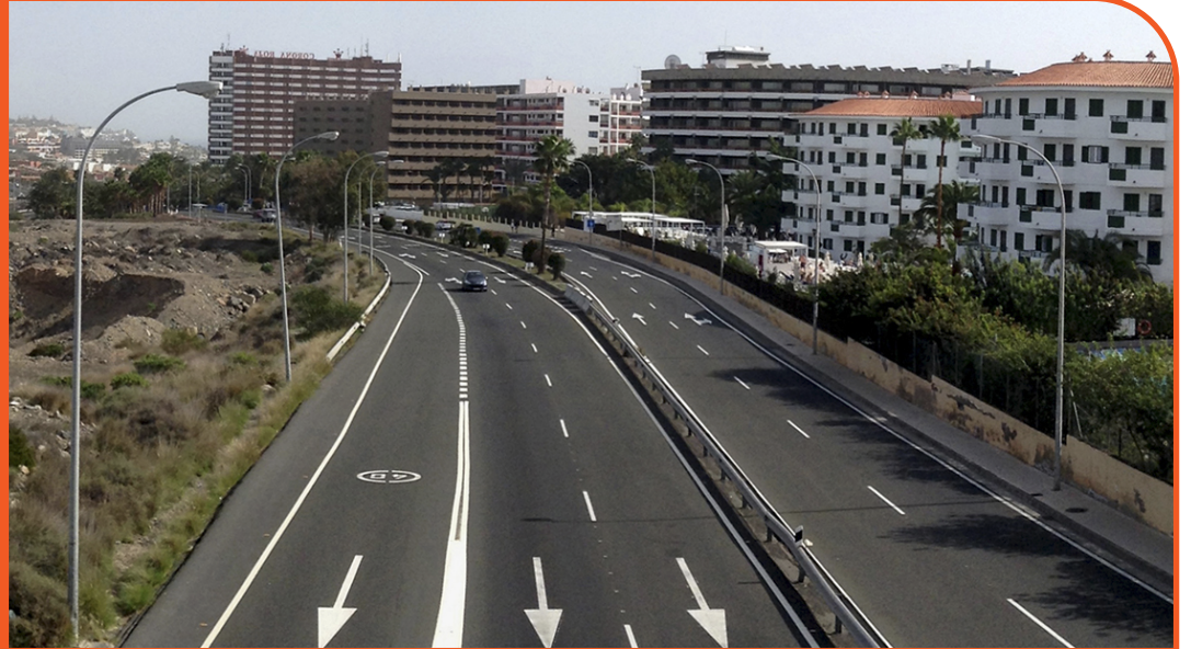
Perspectiva del área y propuesta