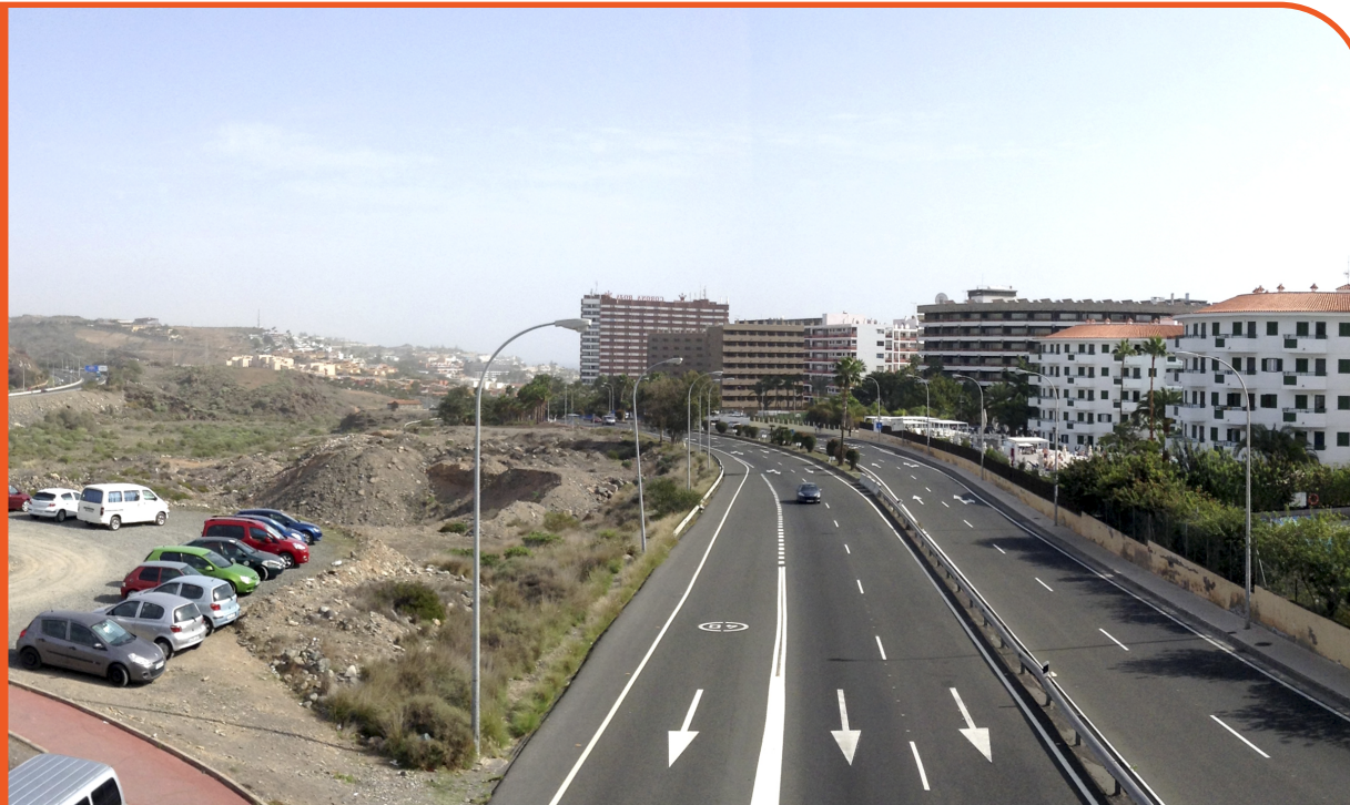
Perspectiva desde la carretera GC-500