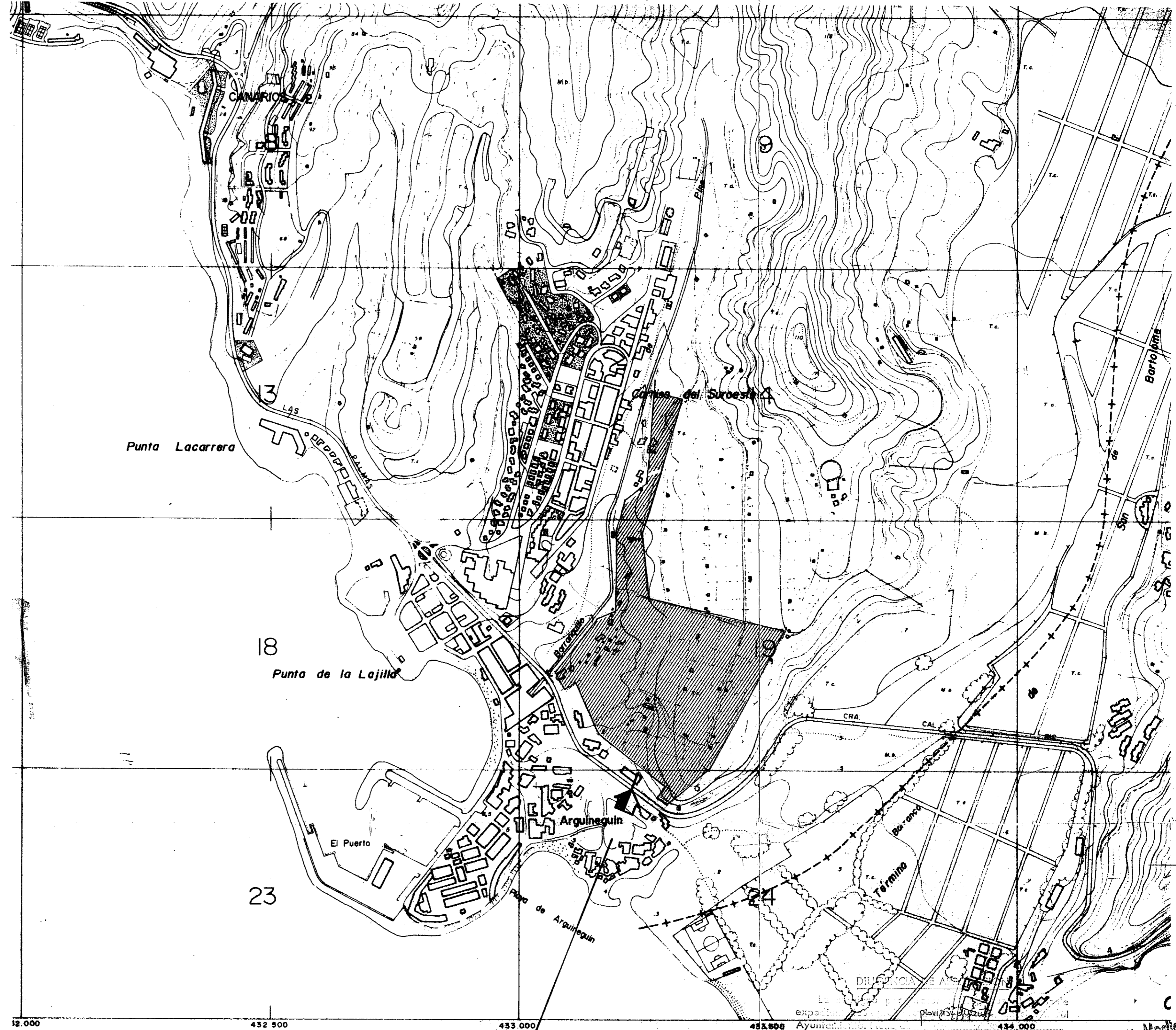
EMPLAZAMIENTO ARGUINEGUIN T.M. DE MOGAN ESCALA 1:5.000