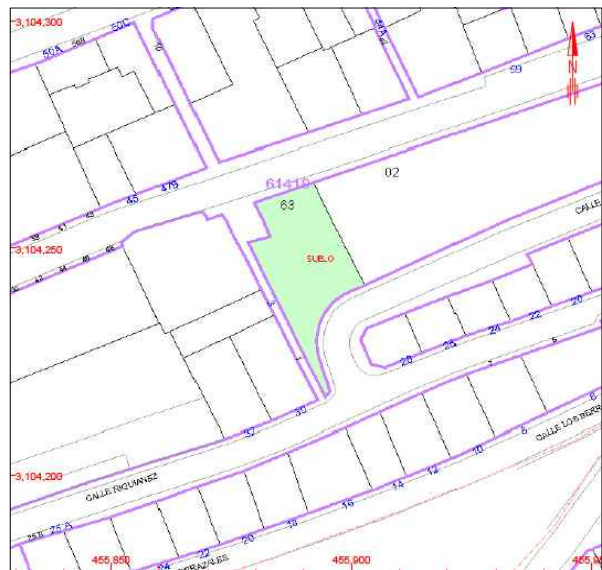
1 REFERENCIA CATASTRAL 6141963DS5064S0001DK