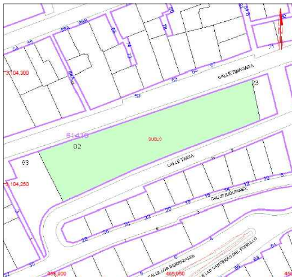
2 REFERENCIA CATASTRAL 6141902DS5064S0001JK