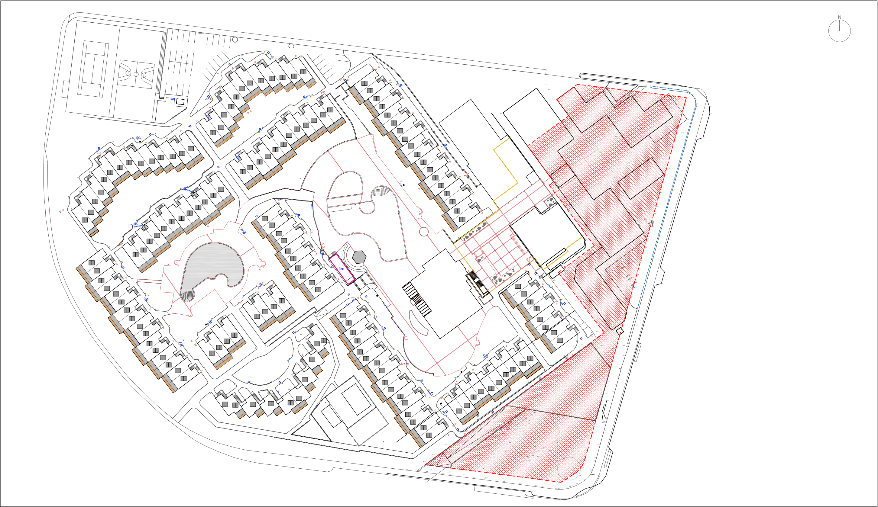
Alternativa 0 - e:1/1000