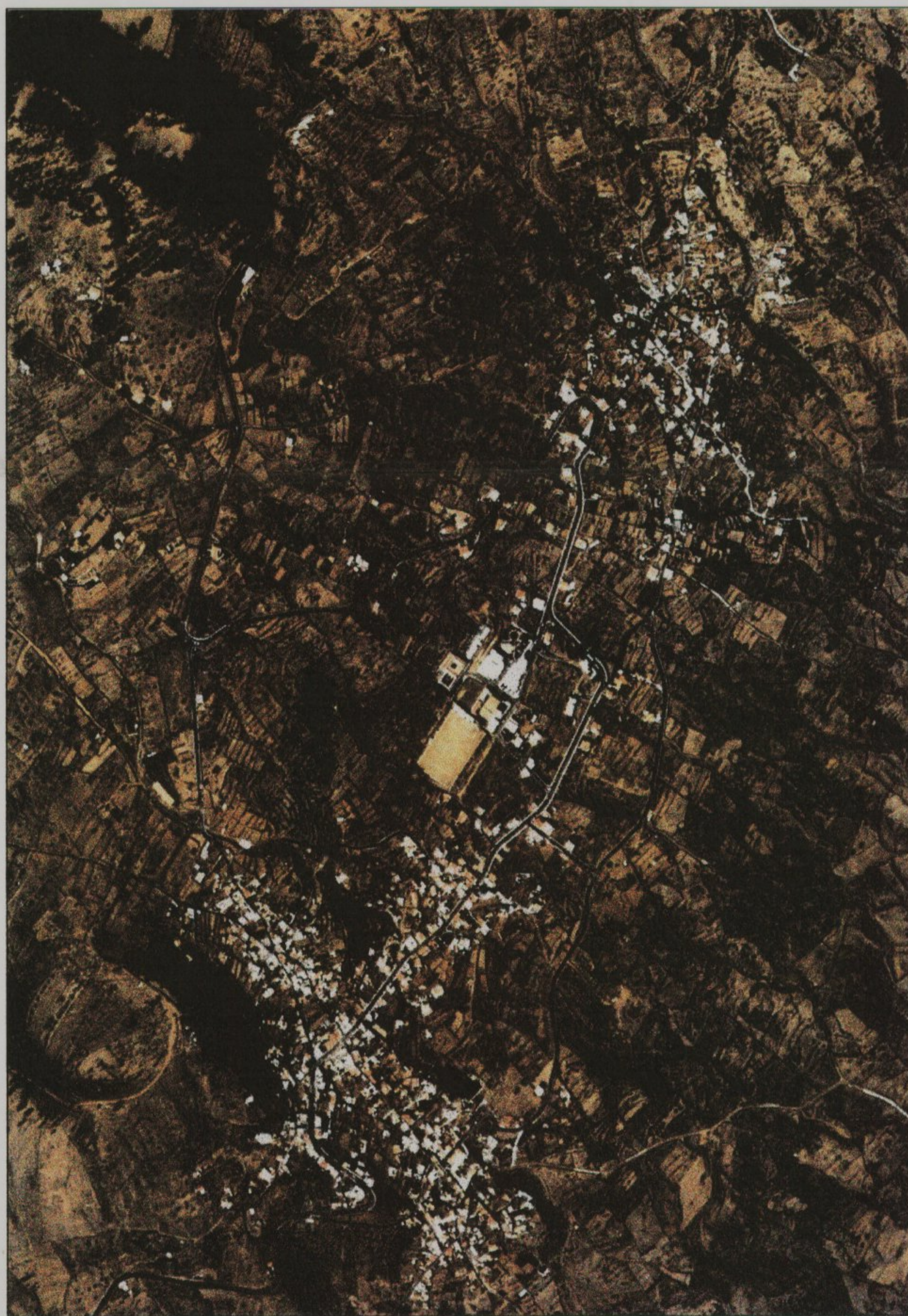
TAIBIQUE - LAS CASAS - EL PINAR