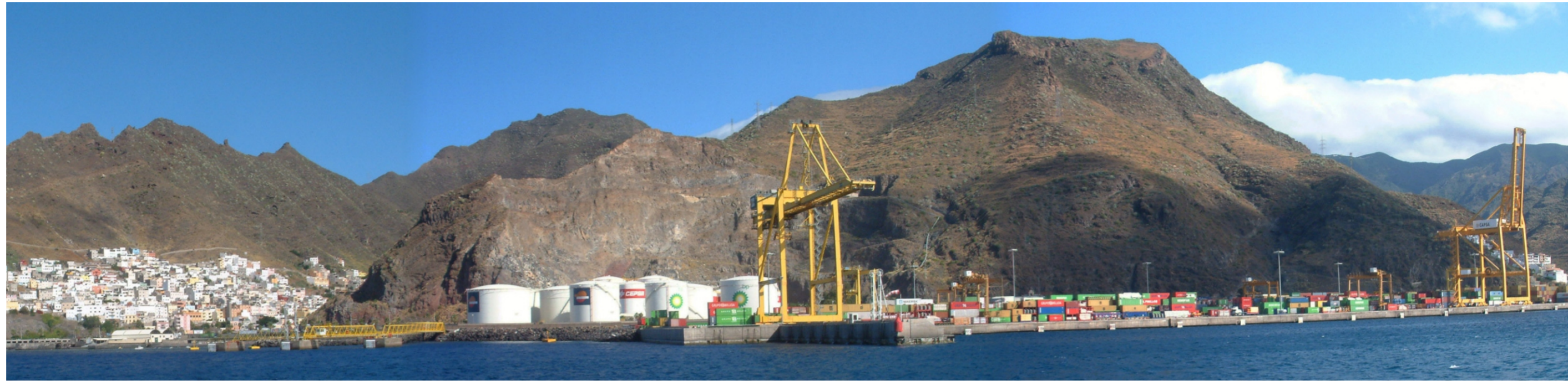
Vista panorámica del Puerto donde se observan los graneles líquidos y la base de contenedores, uso característico en este área funcional.