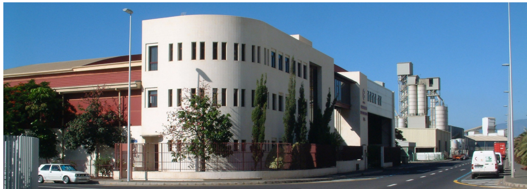
Detalle de la alta calidad estética de uno de los edificios.