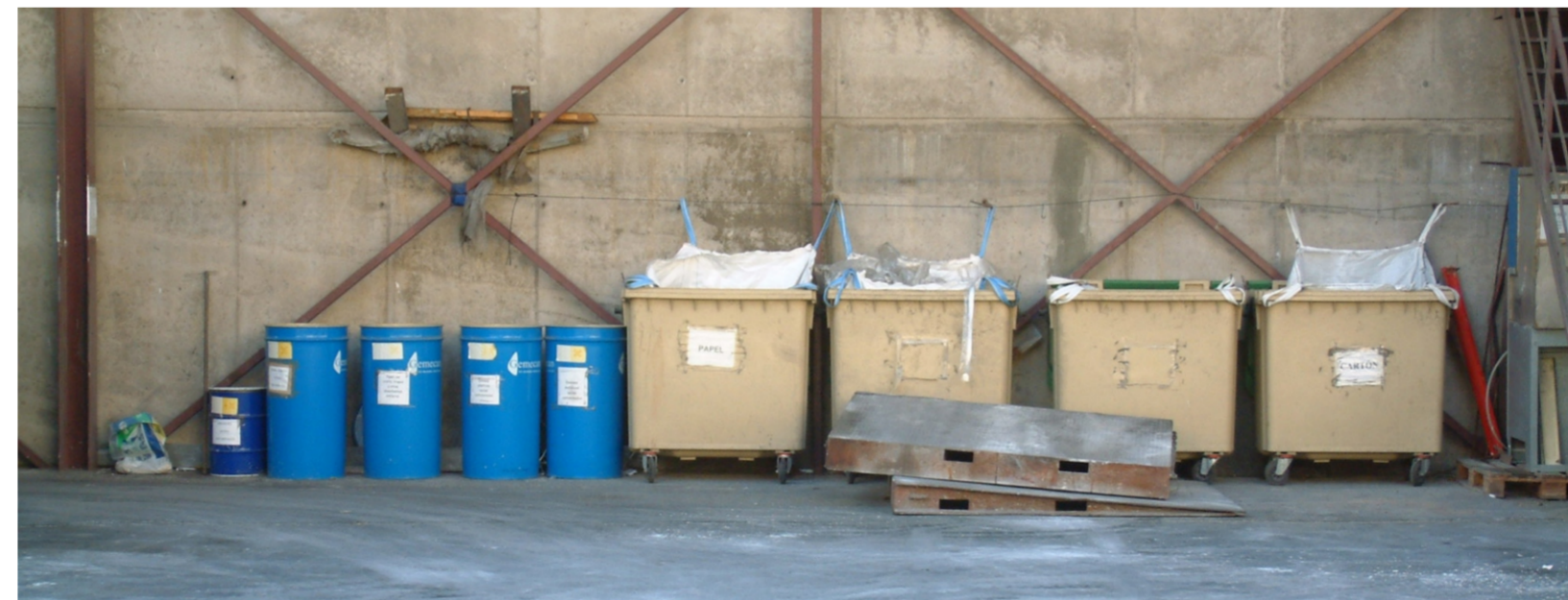
Detalle de la correcta gestión de residuos en una de las instalaciones de este área funcional.