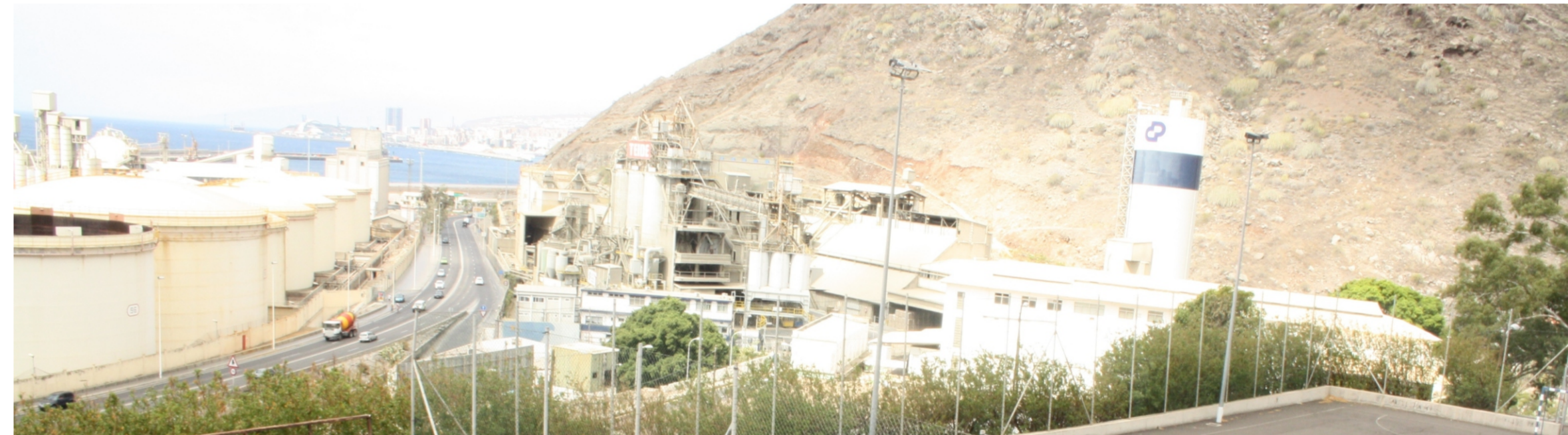
Panorámica donde se observan las instalaciones de la cementera.