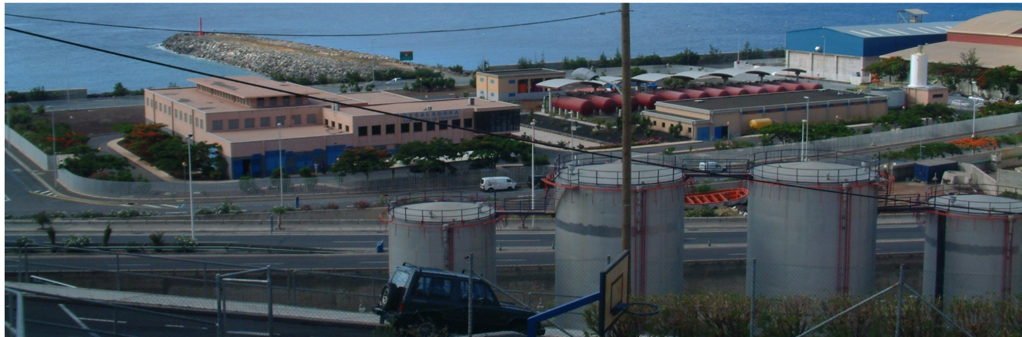
Vista panorámica tomada desde el núcleo poblacional de Cueva Bermeja desde donde se observan, entre otras, las instalaciones de la EDAM.