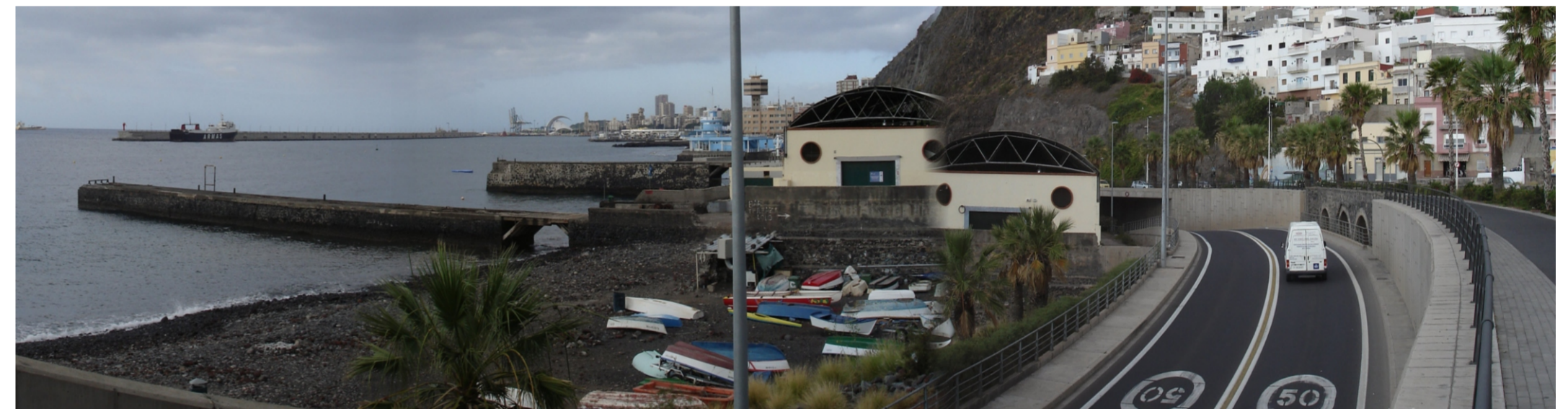
Vista panorámica donde se observa la playa de Valleseco con numerosas embarcaciones, el elemento patrimonial formado por naves y muelles de carbón y la vía de servicio portuaria.