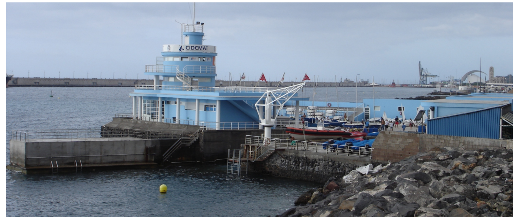
Detalle de edificio CIDEMAT.