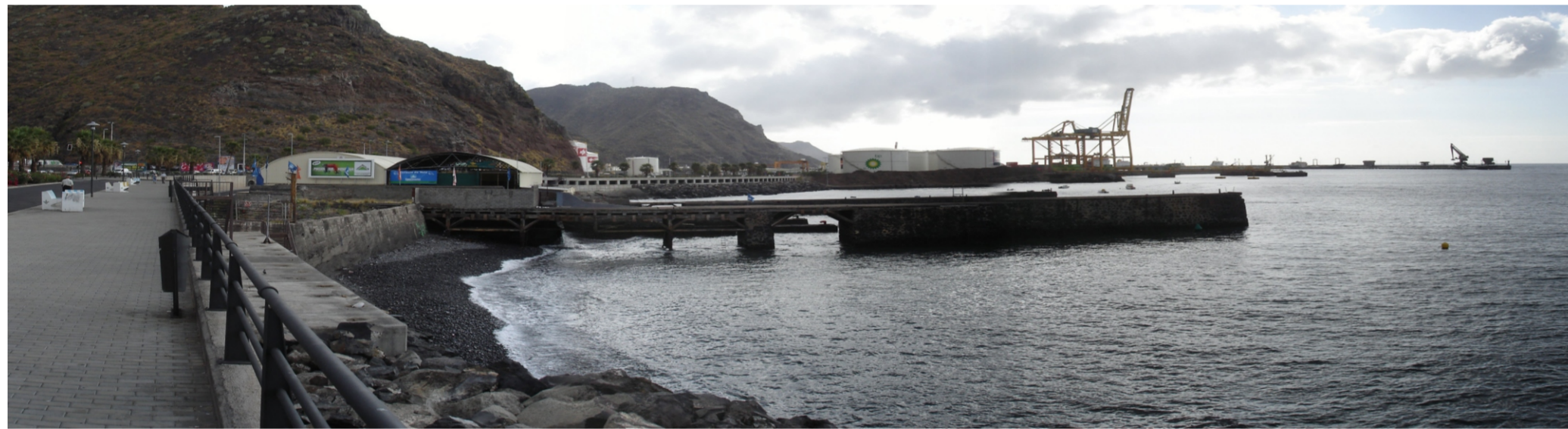
Vista panorámica del litoral de Valleseco, donde se aprecia el elemento patrimonial formado por naves y muelles de carbón.