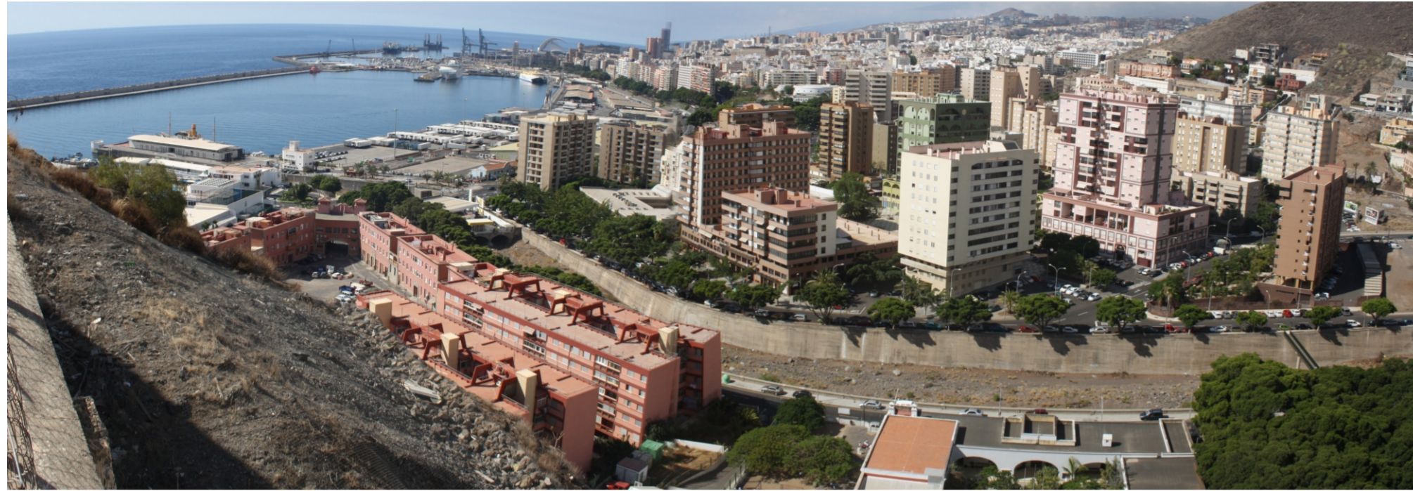
Vista panorámica donde se observan los diferentes usos de este área funcional.