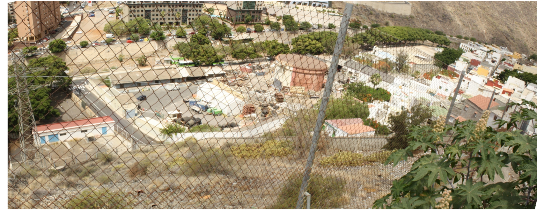
Vista panorámica donde se observan los diferentes usos de este área funcional.