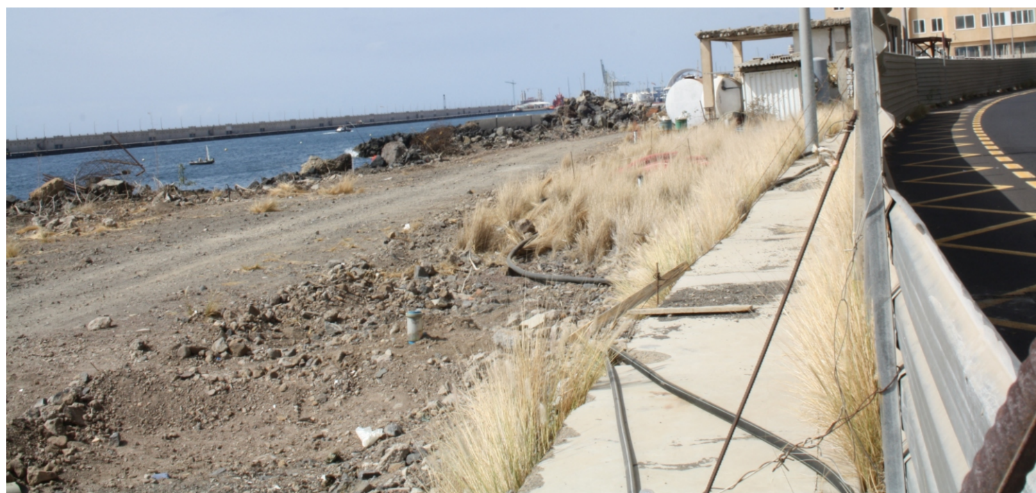
Detalle de los rellenos efectuados en el frente marítimo de Valleseco.