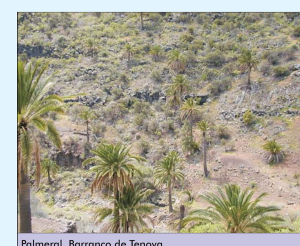
Palmeral. Barranco de Tenoya