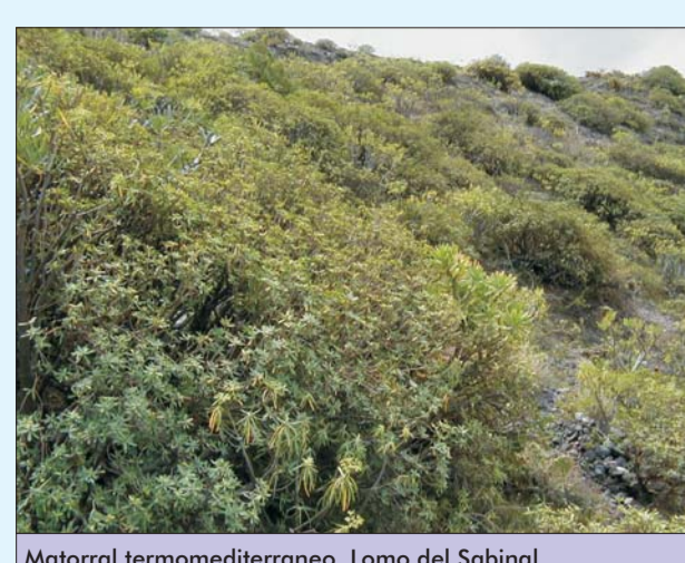
Matorral termomediterráneo. Lomo del Sabilal

Este documento ha sido diligenciado mediante firma electrónica de la secretaria general del Pleno del Ayuntamiento de Las Palmas de Gran Canaria