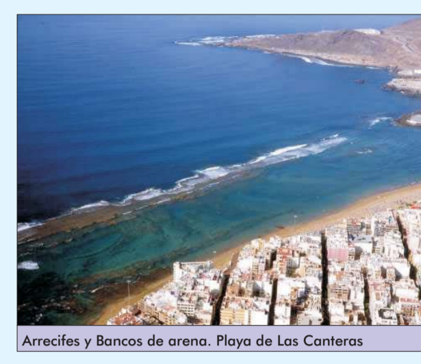
Arrecifes y Bancos de arena. Playa de Las Canteras