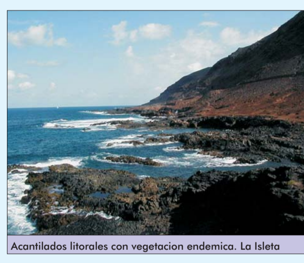
Acanuilados litorales con vegetación endémica. La Isleta