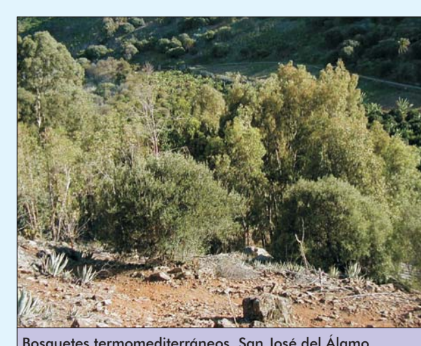
Bosques termomediterráneos. San José del Alamo