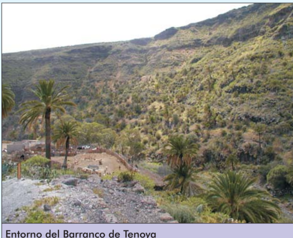
Entorno del Barranco de Tenoya