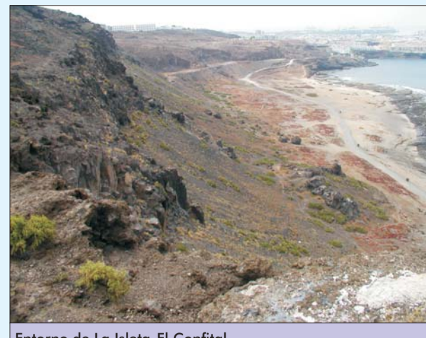
Entorno de la Isleta-El Confital