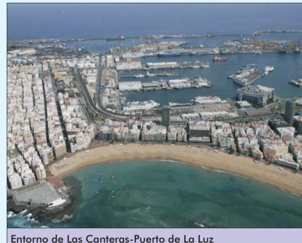
Entorno de Las Canteras-Puerto de La Luz