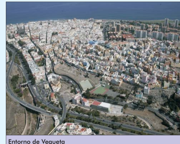
Entorno de Vegueta