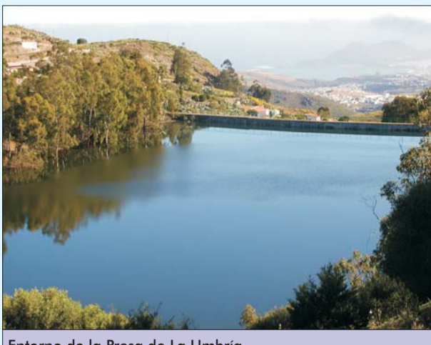
Entorno de la Presa de La Umbria