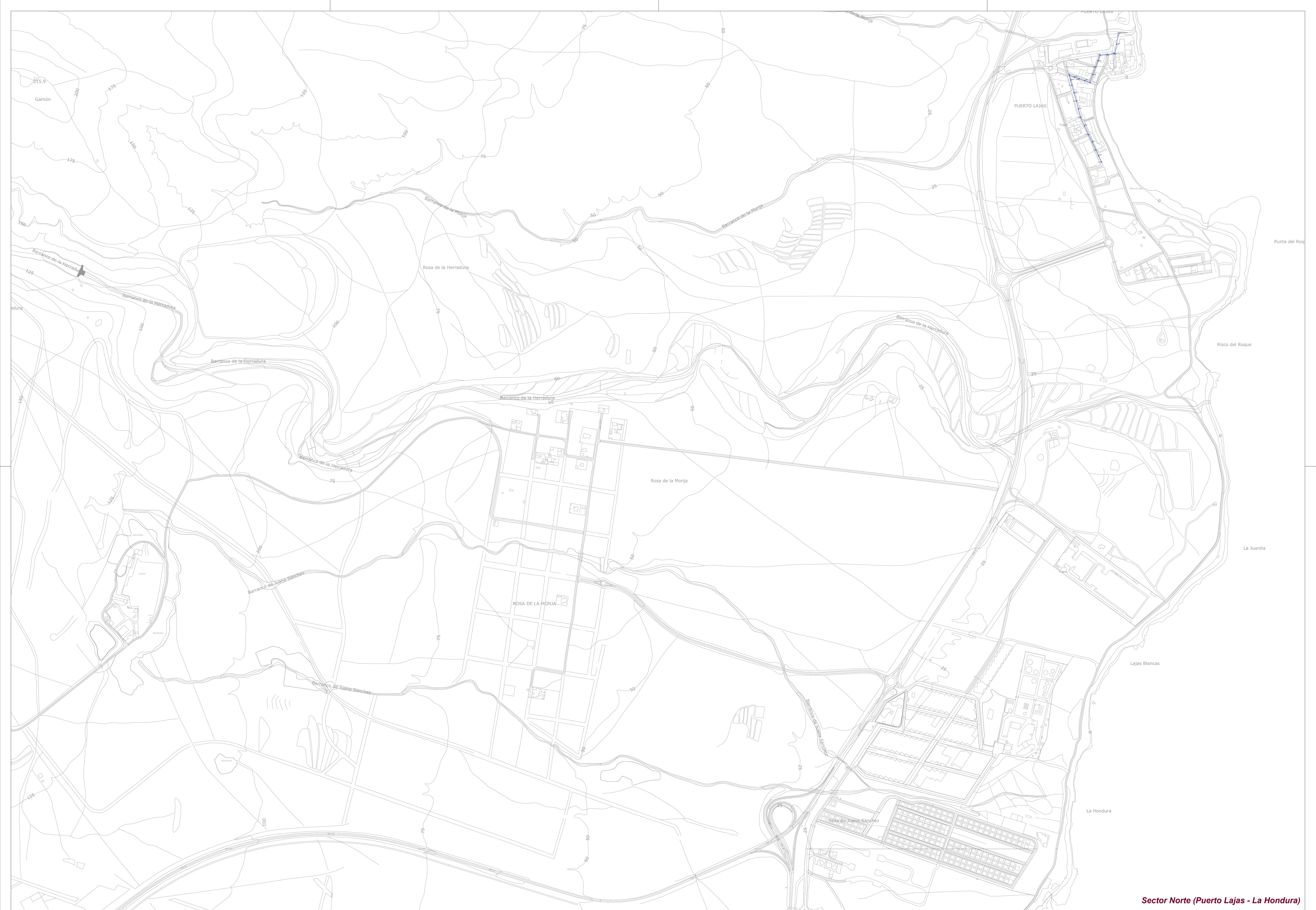
Sector Norte (Puerto Lajas - La Hondura)