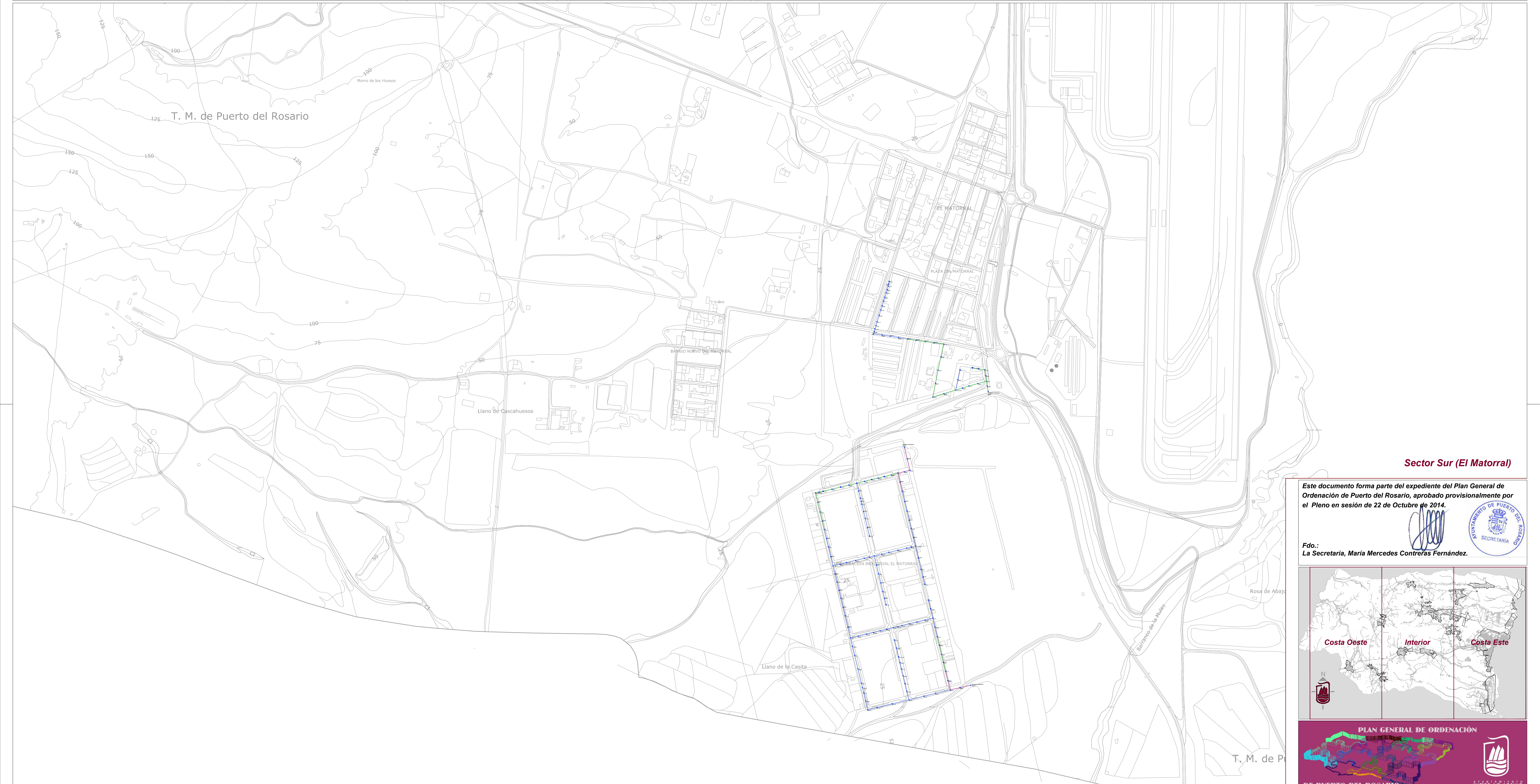
Sector Sur (El Matorral)