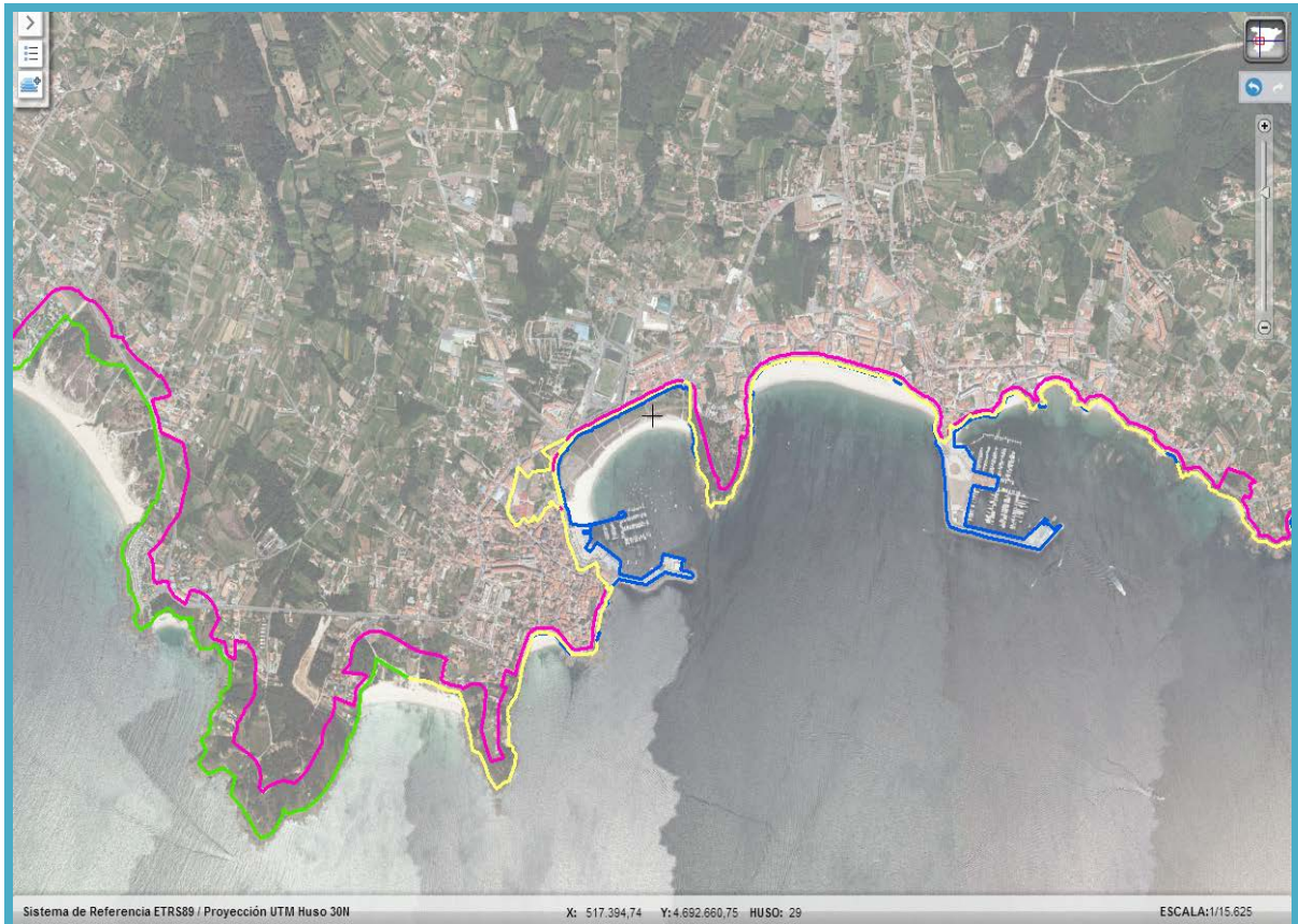
Imagen de detalle de la información del servicio

La cartografía incluida en este servicio contiene las zonas definidas como Deslinde DPMT y la correspondiente información alfanumérica asociada.